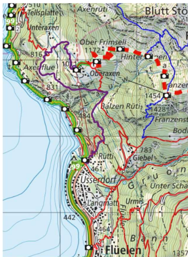
Die Aussicht beim Aufstieg