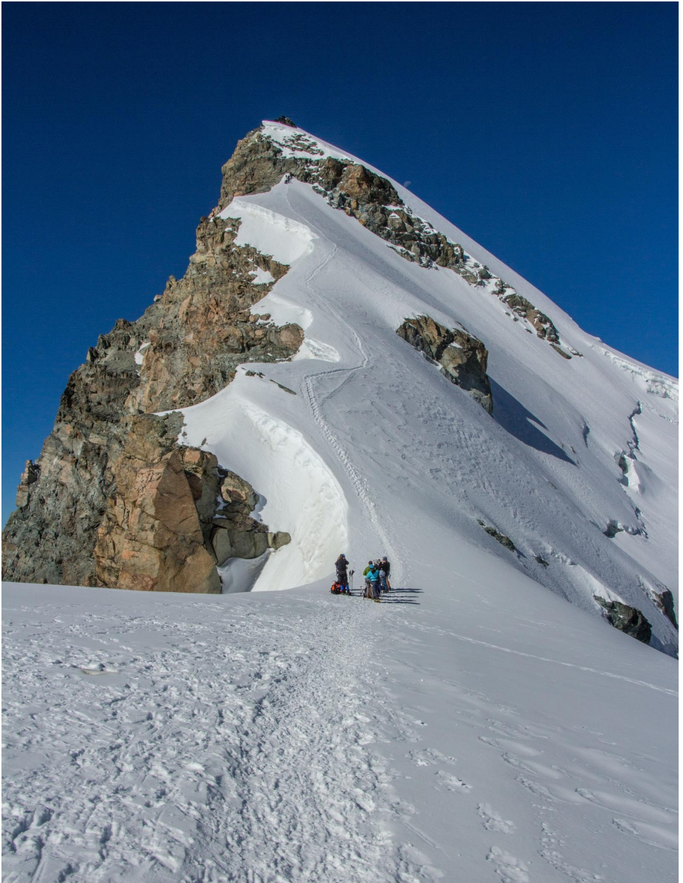
Allalinhorn 4027m Hohlaubgrat